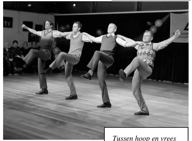
Tussen hoop en vrees