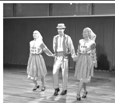
Dans uit Oltenië