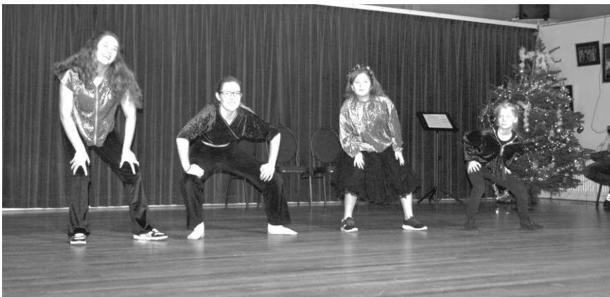
Optreden van de Tieners tijdens Phoenix onder de Kerstboom