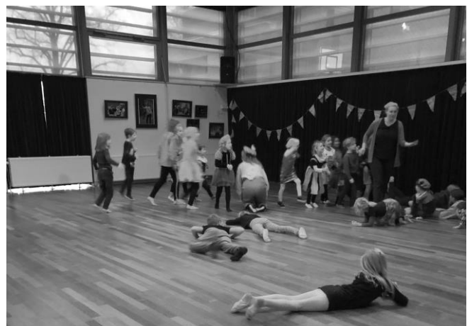
Dans van de Sluitpiet tijdens het Sinterklaasfeest