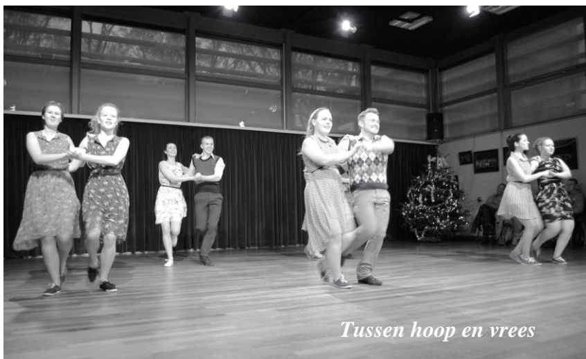
Tussen hoop en vrees

Eindelijk kon het na twee coronajaren weer doorgaan: Phoenix onder de Kerstboom! Het werd weer een heel sfeervolle, drukke en gezellige middag met dansen voor iedereen en kinderdans en knutselactiviteiten voor de jongsten. Tussendoor was het genieten van optredens van de tieners (zie blz 13), Phoenix Vocaal en het Dansensemble van Phoenix. Voor het goede doel, het Jeugdfonds Sport en Cultuur Gelderland, werd een mooi bedrag opgehaald. (zie blz 14).