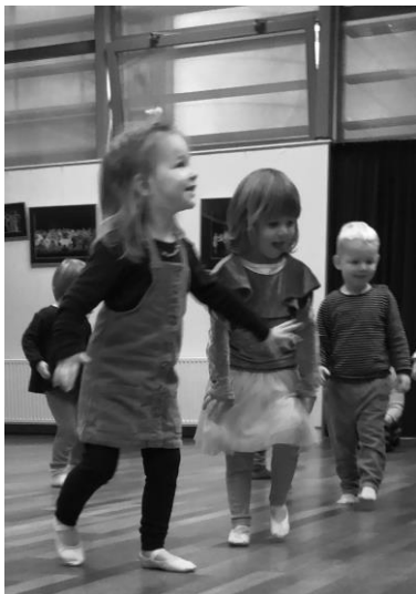
De peuters genieten van alle dansjes!