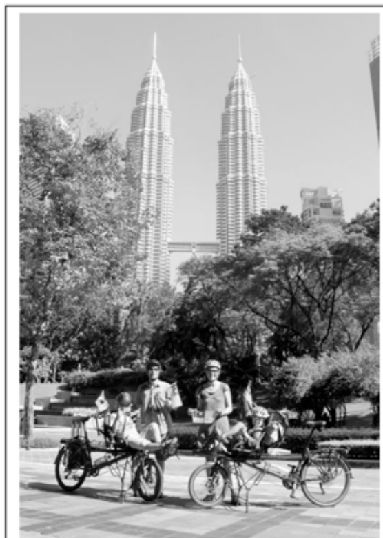
Bij de Petronas Towers in Kuala Lumpur, Maleisië