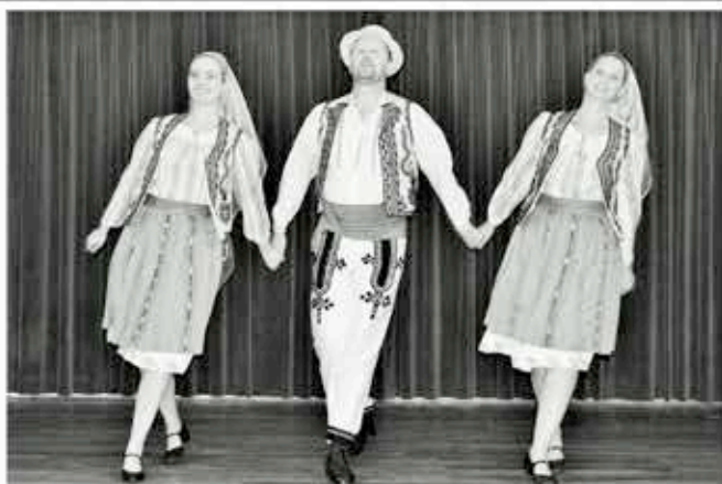
eindvoorstelling Dansensemble 16 juni