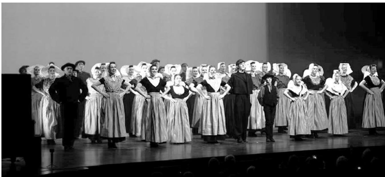
Slotdans Zeeuws met 50 dansers