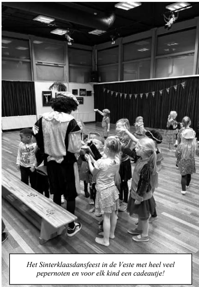
Het Sinterklaasdansfeest in de Veste met heel veel pepernoten en voor elk kind een cadeautje!