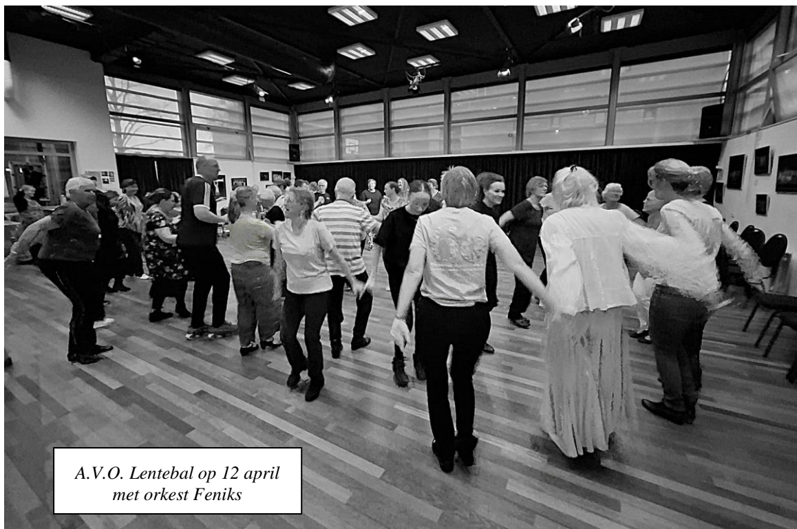
A.V.O. Lentebal op 12 april met orkest Feniks