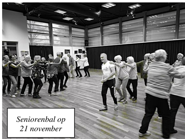
Seniorenbal op 21 november