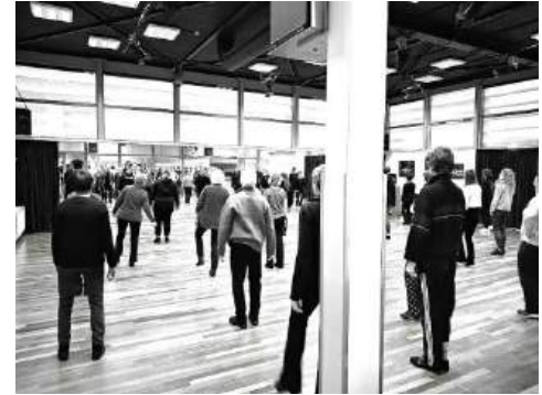
de warming up

TOP om zulke enthousiastelingen bezig te zien!