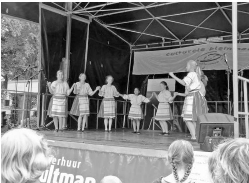
Op zaterdag 11 juni trad de Extra Kindergroep op tijdens de Culturele Pleinmarkt bij Orpheus

Wat : Kerstvakantie Wanneer : 26 december t/m 6 januari